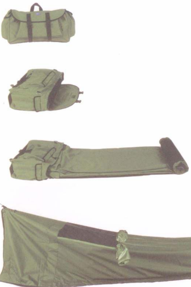
合起來是個手提袋，打開後就可 以是張帳篷床。

Backpack Bed的售價為每張 一九九元，包含運費約六一六〇 元。但若是批發則每次十八元。每 張可睡約二二〇CM Swags for Homeless的售價為每張一 張Backpack Bed的售價為每張 每張 (Essen) 的售價為每張 (Red Dot Magazine) 的售價為每張。